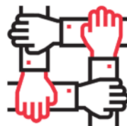
Resource Sharing and Digital Platforms