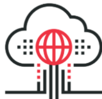
Big Data and Data Analytics