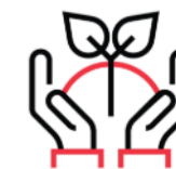
Sustainability, Post Covid

Challenge internazionale promossa in collaborazione con EEN/SIMPLER