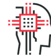
Robotics and Automation